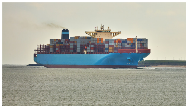
Utbyggnaden av containerfrakter påverkade världsekonomin när stora mängder varor kunde skeppas mellan länder relativt billigt.

Den tekniska utvecklingen var stark under 1990-talet. Nya tjänster och produkter utvecklades och den nya tekniken medförde effektiviseringar och ökad produktivitet under början av 2000-talet. Samtidigt ökade konkurrensen mellan internet-baserade företag och vanliga butiker, vilket minskade utrymmet för prishöjningar. Teknisk utveckling i kombination med fördjupat ekonomiskt samarbete mellan länder gjorde att flera bedömare så sent som 2021 trodde att inflationstakten inte skulle dra iväg under 2022. Men pandemin minskade det globala utbudet och det pressade upp världsmarknadspriserna på varor och insatsvaror. Utbudsproblemen påverkar fortfarande priserna.